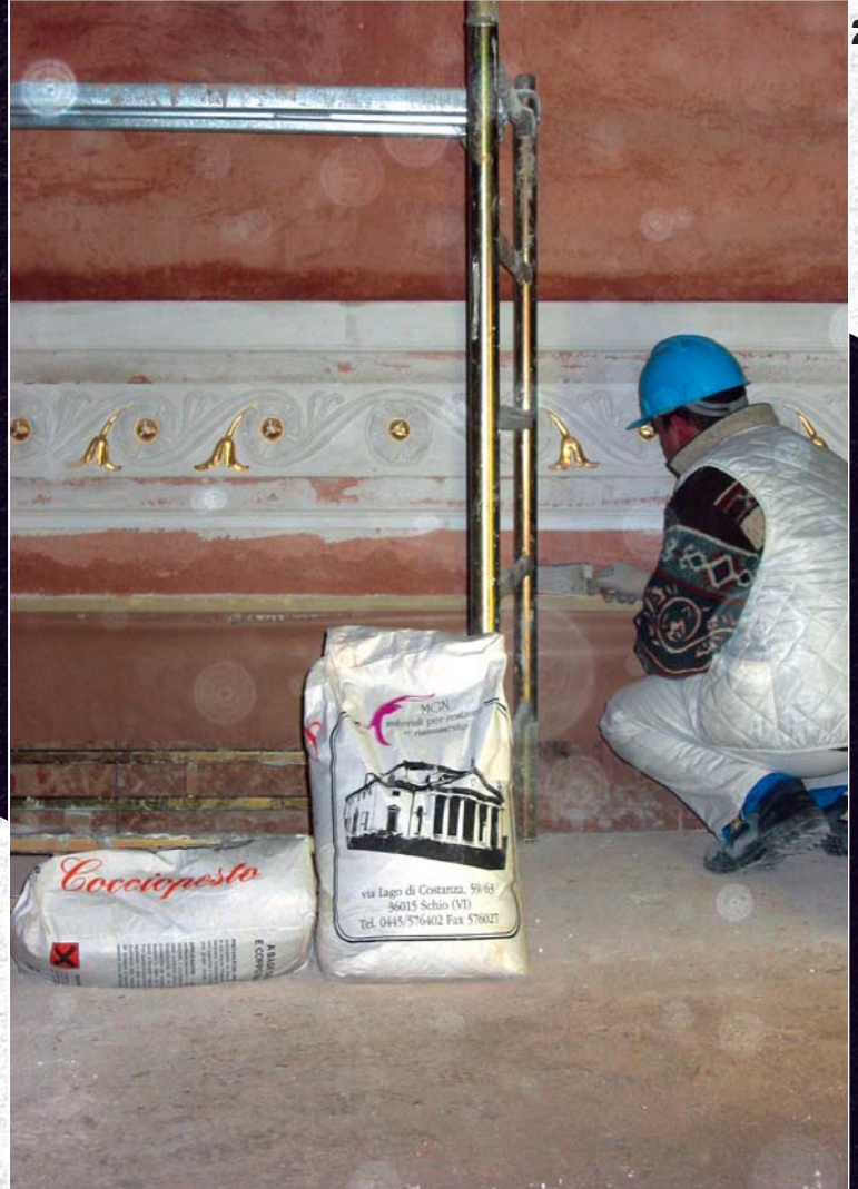
19/20/21 Nelle foto possiamo vedere la prima fase di intonacatura interna del teatro. Tale lavorazione è stata realizzata tramite stesura di intonaco a cocciopesto MGN.