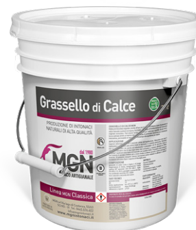
Codice: Codice: GRAS01

GRASSELLO DI CALCE MGN è una malta in pasta a base di grassello di calce stagionata in fossa, polveri di marmo carbonatiche micronizzate, di granulometria fine. Viene utilizzato per lucidare a ferro il MARMORINO MGN. Gode di una colorazione naturale, stabile e resistente alle intemperie in quanto realizzato con l'esclusivo ausilio di terre colorate naturali e polvere di marmo, quindi non soggetta a dilavamento. Disponibile in 24 tinte diverse, mescolabili tra loro oppure riproducibile a richiesta del cliente.